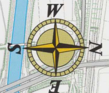
城北高等学校 かぎ保管庫