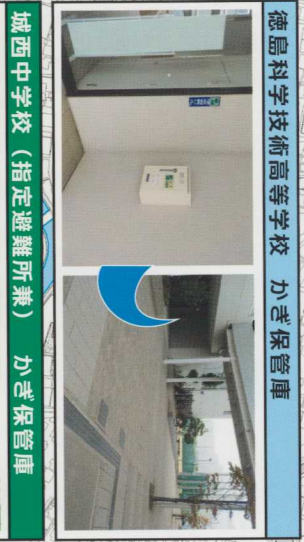
徳島科学技術高等学校 かぎ保管庫