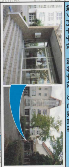
四電工田宮寮 かぎ保管庫