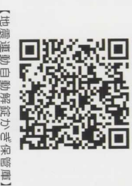
【地震運動自動解放かぎ保管庫】