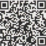
【指定避難所・補助避難所】

避難所の開設順序、機能の違い、指定避難所の備蓄物資等の詳細は、徳島市HP (右QRコード) で確認できます。