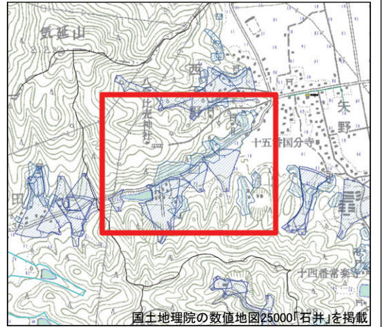
国土地理院の数値地図25000「石井」を掲載 位置図（1/25,000）

（※）平成25年から27年の台風時に徳島市が確認した道路冠水箇所と地元消防団が大雨時に確認した道路冠水箇所を記載しています。降雨の状況によっては、他の場所も冠水するおそれがありますので注意してください。