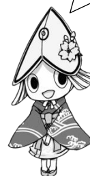
徳島市イメージアップキャラクター トクシィ

皆さまの貴重なご意見が 徳島市の未来を創ります。 ご協力をよろしく申し上げます。