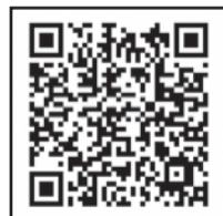
廃蛍光管回収 拠点一覧