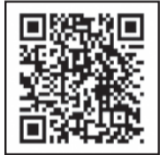
乾電池 回収拠点一覧

※乾電池に限り、粗大ごみを出すときに透明の袋に入れて出していただくこともできます。