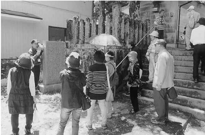
浅川の津波史跡の見学

す。地区の皆さんにもこのマップには大きな関心を持っていただき、毎回のワークショップには大勢の参加者があります。この資機材の確保と津波避難支援マップの完成後には、新町地区自主防災連合組織の皆さんと地区コミュニティ協議会・町内会と連携した地道な避難訓練や防災訓練の実施を予定しています。