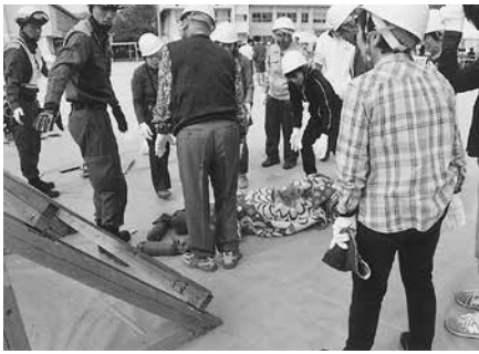
倒壊家屋からの救出訓練

「十月十六日午前九時ごろ、南海トラフ沿いの震源とする強い地震が発生し、徳島市では最大震度六強が観測された。不動地区では、家具の転倒や火災、道路の寸断が発生し、電気・ガス・水道・交通機関等のライフラインも被害を受けている。」という想定で訓練が開始されました。所要時