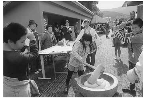
地元有志による餅つき

他にも、手作りの竹馬や水鉄砲コーナーがあり、子どもたちは地域の方に教えてもらい初めての竹馬に挑戦して歓声をあげていました。また、祭りの目玉として、