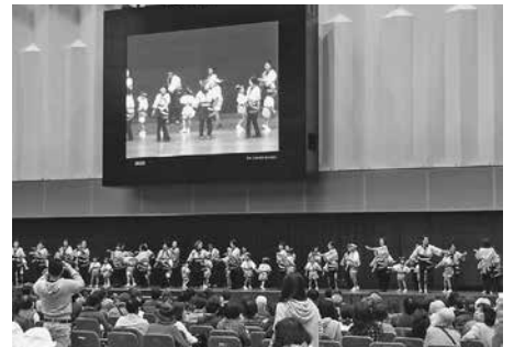
子どもの阿波踊り

展示・体 験ブースで は、地域活 動を紹介す るパネルや 写真の展示 、人形浄瑠璃 の展示など 、それぞれの 地域を知っ てもらおうた めに工夫を