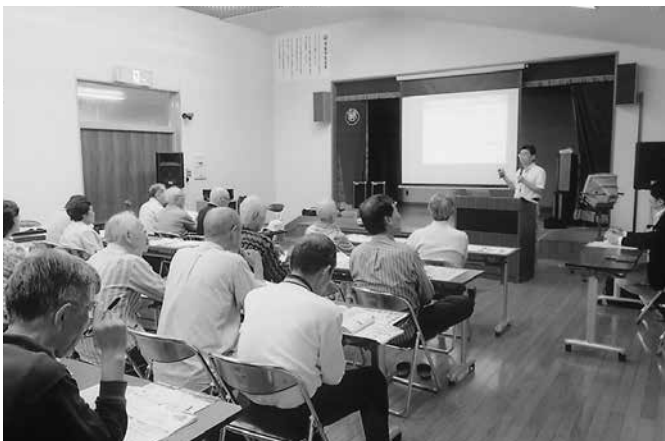
津波避難支援マップの作成