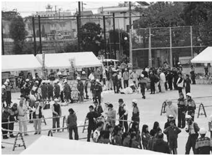
グラウンドでの訓練の様子

「十月十六日午前九時ごろ、南海トラフ沿いの震源とする強い地震が発生し、徳島市では最大震度六強が観測された。不動地区では、家具の転倒や火災、道路の寸断が発生し、電気・ガス・水道・交通機関等のライフラインも被害を受けている。」という想定で訓練が開始されました。所要時