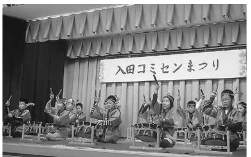
芸能大会（締め太鼓）

平成二十八年十一月十三日（日）、地域の協力のもと、入田コミセン祭りを盛大に開催しました。