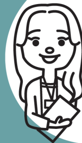
JTB ふるさと納税 担当者