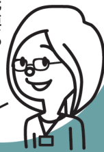
徳島市 ふるさと納税 担当者