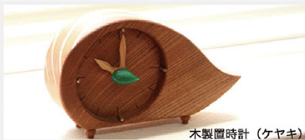
木製置時計 (ケヤキ)