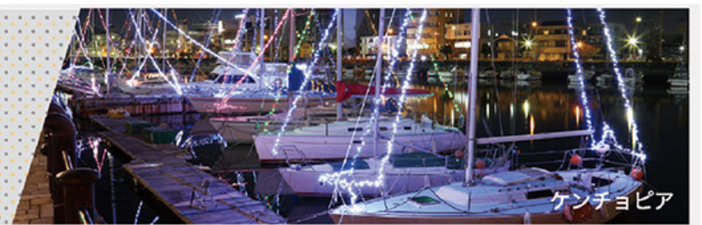
ケンチョピア ※徳島市ふるさと納税は、徳島市外居住の方が対象です