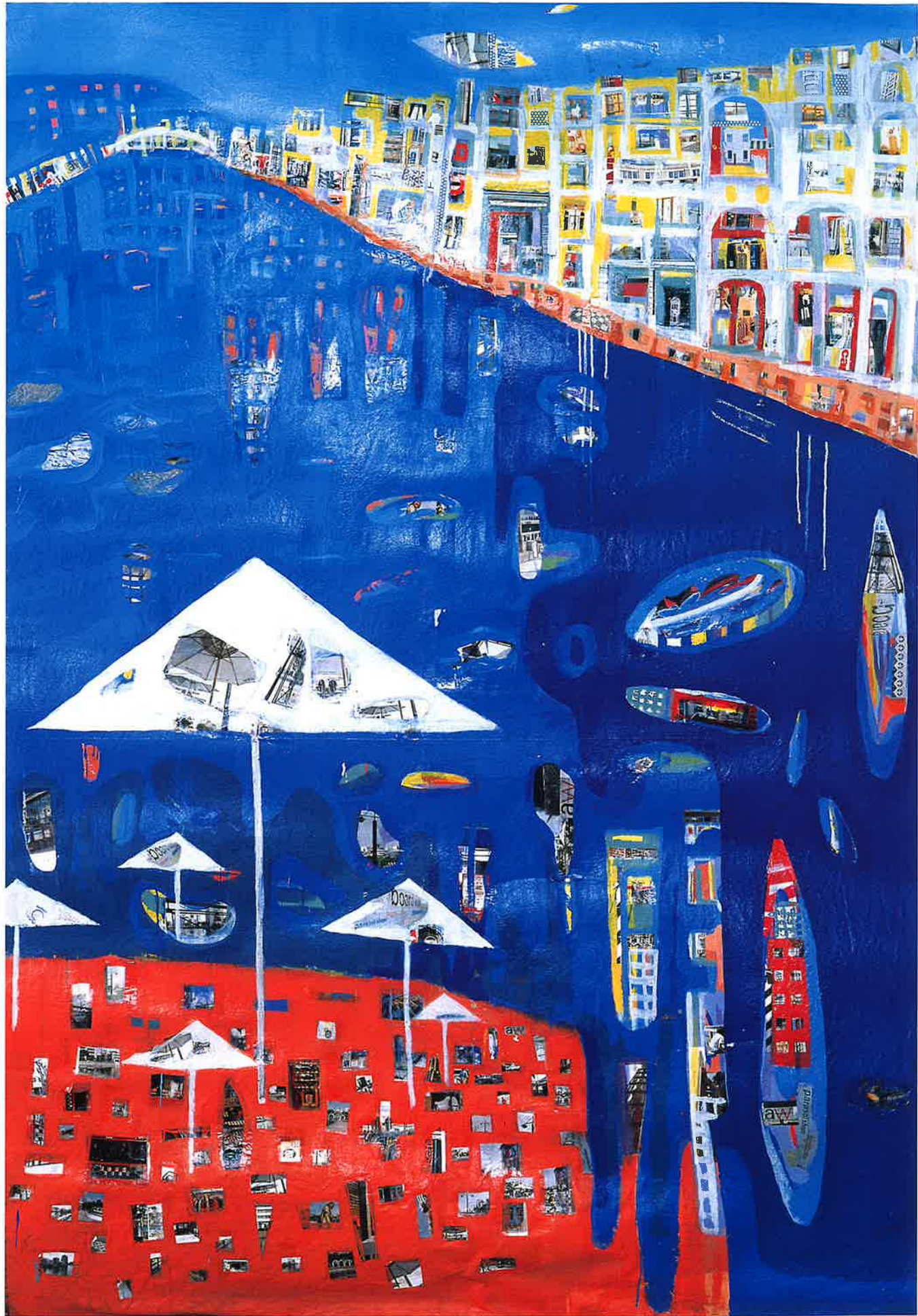
■作者名/美鳥悦子・作品名/ミズギワ・天地2320mm×左右1520mm