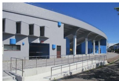
▲メインスタンド外観