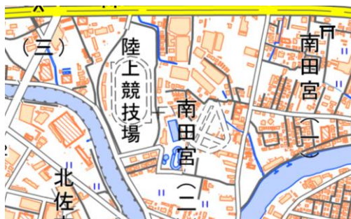
徳島市南田宮二丁目116番地の2

陸上競技力の向上に大きく寄与し、様々な大会や市民のランニングにも利用され、憩いの場として親しまれている施設。令和元年に全面改修工事が完了し、日本陸上競技連盟より第2種公認を取得しており、令和6年度に更新予定である。