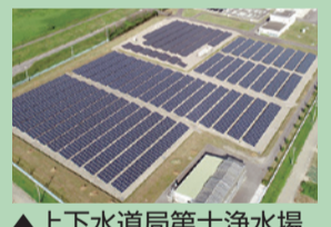
▲上下水道局第十浄水場

再生可能エネルギーである太陽光発電設備を市の施設に導入するとともに、住宅向けの設置費用を一部補助。