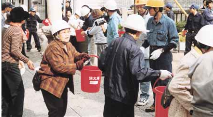
佐古地区で行われた自主防災訓練 (昨年)

多くの尊い生命と貴重な財産を一瞬のうちに奪った阪神・淡路大震災からまもなく9年が経過します。わたしたちはこの震災で、地域に住む人たちが互いに助け合うことの大切さや、ボランティアの力の大きさなどに気づかされ、防災や支援のあり方などを学びました。