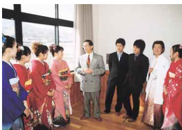
ことし元旦の成人式で新成人の皆さんと=入田公民館

皆さんの熱い心と強い思いによって、まちが築かれます。どうぞ、成人となられた皆さんは、それぞれが個性ある能力を十分に発揮し、これからの徳島市を担い、新しい歴史を刻んでいくくださるよう強く期待しております。