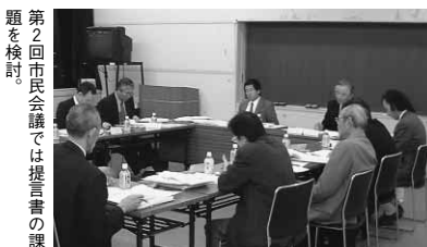
第2回市民会議では提言書の課題を検討。