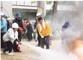
真剣な表情で訓練に臨む皆さん

「防災とボランティア週間」です。東南海・南海地震の発生が心配される中で、あらためて防災に対する意識を高め、災害時に自分ができるボランティア活動や、被害を最小限に食い止めるための自主防災活動について考えましょう。 ●自主防災組織の結成で地域の防災力を高めましょう 大規模地震が起こった場合、災害の同時多発や、道路や橋の損壊による交通障害などで、行政や防災関係機関だけでは十分な対処ができないことが予測されます。被害をできるだけ少なくするためには、災害発生直後の迅速的確な自主防災活動が重要であり、このために、地域の住民同士が「自分たちのまちは自分たちで守る」という連帯意識を持ち、いざという時に連携して組織的な防災活動が行える体制を整えておくことが必要です。