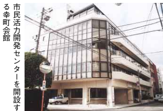
市民活力開発センターを開設する幸町会館

●徳島市の広報番組 『マイシティとくしま』(四国放送テレビ) 毎週日曜日 11:50~正午放送 『こんにちは徳島市です』(ケーブルテレビ徳島) 毎日4回週替わりで放送