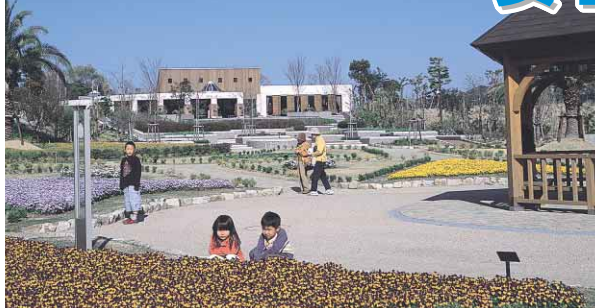
花の季節を迎え、色とりどりの花が目を楽しませてくれます(とくしま植物園)