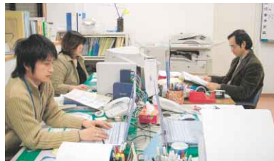
専任スタッフが常駐し、市民活動をサポートする市民活動開発センター

市民活動のノウハウを具体的にアドバイスするので、気軽に相談してほしいと話している。市民活動のノウハウを具体的にアドバイスするので、気軽に相談してほしいと話している。