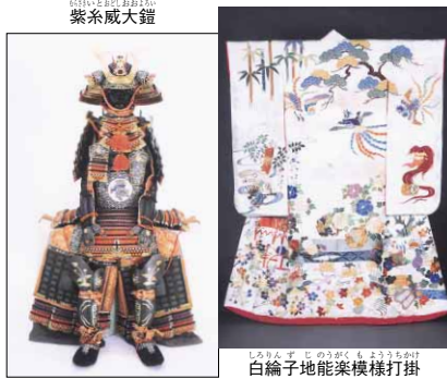
紫系威大鎧 (左) 白織子地能楽模様打掛 (右)

江戸時代の美術品の中に、犬や猫、鶴亀、獅子(しし)などだけでなく、龍(りゅう)や鳳凰(ほうおう)などの動物が数多く登場します。