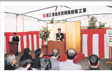
11月13日に行われた工事起工式

▼検査機器 放射線科などの医療機器を充実し、高度な医療に対応することとします。 【問い合わせ先】徳島市民病院 徳島市 510