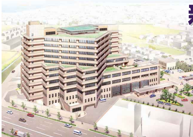
新病院の完成予想図(西側上空から見る)

市では、このほど徳島市民病院新築工事に着手しました。新病院は、今年度から5カ年計画で二期工事に分けて建設するもので、現在の市民病院と園瀬病院を統合し、地域における中核的病院として、高度で良質な医療を提供し、市民に信頼される病院を目指します。