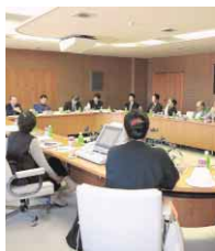
参加したモニターからは「災害に備える防災活動の啓発をもっとしてほしい」「改めて、各個人の意識が大切だと感じた」などの声が聴かれました。

勉強会では市の担当職員が行った対応などに触れながら防災対策、地域防災力の重要性などを説明。また地域での防災活動例として、沖洲地区自主防災会議の取り組みが同代表者から紹介され、その後質疑応答に移りました。