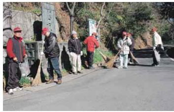
スイセン香る散歩道を清掃する眉山ふれあい会の皆さん

◆ひなの煎(せん)茶会 徳島一茶番の会による煎茶のお手前。3月12日(日)10時～15時