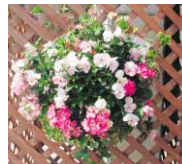
▲いずれも写真は昨年度 ▼の受賞作品

とくしま植物園では、第5回ガーデニングコンクールの出品作品を募集します。出品いただいた作品は、同園で4月29日(日)～5月7日(日)の間、展示します。 【参加資格】市内在住・在勤の人 【募集作品】◆規定コース＝とくしま植物園で配布する規定の鉢またはバスケットを使用。コンテナガーデン部門20作品、ハンギングバスケット部門15作品 ◆フリースタイルコース＝各自用意の鉢などで自由に作品づくり約30作品(各部門とも1人1作品で、応募多数の場合は抽選) ※作品はおおむね直径80センチ、高さ1メートル以下のもの。規定コースの鉢・バスケットは3月21日(祝)～28日(日)の9:30～16:00に配布。ただし、花苗・土などの材料は出展者で用意のこと。 ※なお、規定コースの作品は屋外展示できるものに限りません。 【参加費】規定コース600円(鉢代含む)、フリースタイルコース無料 【作品搬入】4月29日(祝)9:30～13:00 【審査】4月29日(祝)14:00～ 【表彰】各コース・各部門につき最優秀賞1点以内、優秀賞1点以内、入選3点以内 【申し込み】往復はがきにはコース名・部門名(フリースタイルコースへの応募もコンテナガーデン・ハンギングバスケットなどの作品ジャンルを明記)・住所・名前・年齢・電話番号・返信先あて名を記入し、3月14日(火)(必着)までに、とくしま植物園緑の相談所(〒771-4267 渋野町入道45-1)へ。また、徳島市ホームページの「電子申請」からの申し込みも可。 【問い合わせ先】とくしま植物園緑の相談所 ☎636-3131