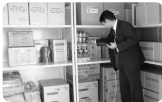
搬入した応急物資を確認する職員