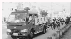
昨年の防火パレード(渭東地区)

春先は、山菜採りやレジャーなどで山に入る機会が増加することから、防火意識の高揚を図るため、林野火災消防訓練を実施します。 【日時】3月16日(水)10:30～ 【場所】名東町1丁目 地藏院池縁地付近山林一帯 【問い合わせ先】消防局予防課(☎656-1193)