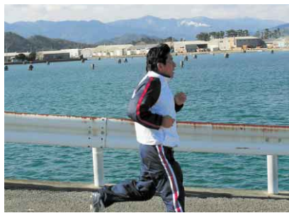
▲海辺を走る原市長＝昨年2月の津田駅伝大会