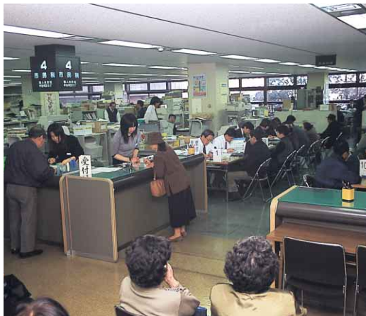
申告はお早めに(市役所2階市民税課)

平成19年1月1日現在、徳島市内に住み、平成18年中に所得のあつた次の人 ▼給与所得者で、給与以外に所得のあつた、勤務先から給与所得者、勤務先から給与と支払報告書が