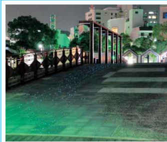
▲今夏、LED景観整備事業が完成した新町川水際公園とふれあい橋▼