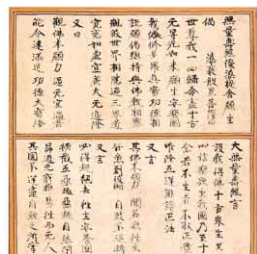
▲重要文化財 教行信証(たんじょう)蓮如筆 室町時代