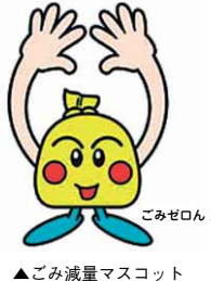
▲ごみ減量マスコット

食材を有効に活用し、無駄を少なくすることです。日ごろの調理時に少し工夫をすることで、家計の節約を図るとともに、ごみの減量に大きな効果をもたらします。