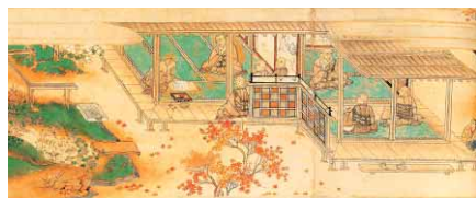
▲重要文化財 本願寺聖人親鸞伝絵(部分) 南北朝時代 大阪・天満定坊

十六人家集」に代表される古筆、美しい障壁画など、国宝5件、重要文化財26件を含む約1500件を展覧する「本願寺展」を開催します。本願寺の歴史を物語る文化遺産と美の世界をのぞいてみませんか。