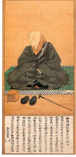
▲国宝 安城御影(あんじょうのごえい) 副本(親鸞聖人肖像) 室町時代 [10月4日~19日展示]