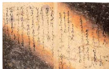
▲国宝 三十六人家集 37帖のうち躬恒集(みつねしゅう) 平安時代 [10月4日~26日展示]