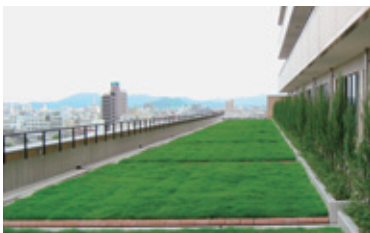
▲市民病院のバルコニーに設置された緑の庭園