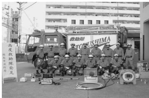
▲高度救助隊員と高度救助用器具

この高度救助隊には、人命救助に関する高度な教育・訓練を受けた15人の隊員が所属し、高度救助用器具が