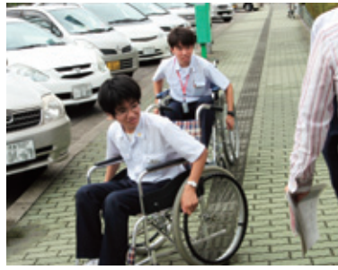
▲鳴門教育大学付属中学生による市役所のユニバーサルデザイン点検の様子

【対象】市内在住で▶5歳児(1年保育)＝平成16年4月2日～平成17年4月1日までに生まれた幼児▶4歳児(2年保育)＝平成17年4月2日～平成18年4月1日までに生まれた幼児 【通園区域】小学校校区に準じます。幼稚園の未設置地区は最寄りの幼稚園へ。 【受付期間】9月1日(火)～12月22日(火)の8:30～17:00(土・日・祝日は除く) 【申し込み方法】各幼稚園にある入園願書に必要事項を記入し、近くの市立幼稚園へ提出。入園願書は徳島市ホームページからもダウンロードできます。 【問い合わせ先】各幼稚園、学校教育課(☎621-5413)