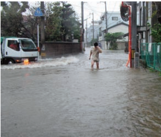
▲平成16年の台風23号による冠水の様子

(前月比) 人口 258,805人(-78) 男 123,016人(-32) 女 135,789人(-46) 世帯数 111,420世帯(+69) 面積 191.58km 2