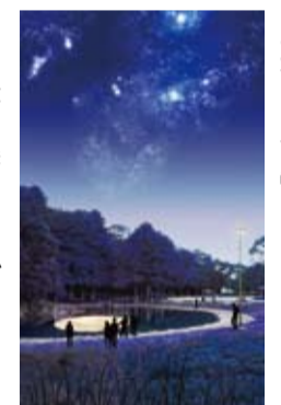
▲「水中の名月」のイメージ

【観覧】8月27日(土) 18時30分～21時 【作品展示】22時～(作品展示は22時まで)