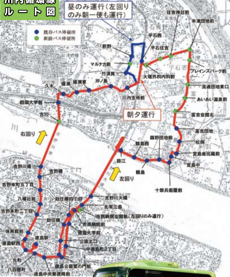
川内循環線 車両イメージ 路線バスとして本市で初めてとなる環境に優しい小型ノンステップバスを導入(乗車定員33人程度)