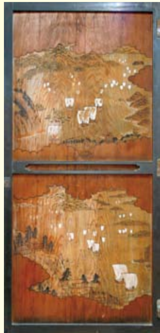
▲山西家旧蔵板戸(徳島県立博物館蔵)

阿波の玄関口である撫養港を拠点に、全国規模の商売を繰り広げた大海商・山西家ゆかりの品々を展示します。