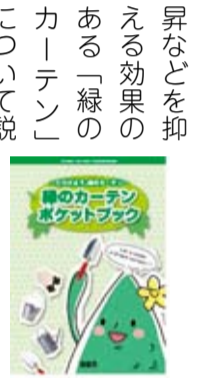
緑のカーテンポケット

▽使わない電気はこまめに消す ▽テレビは主電源から消す ▽エアコンの設定温度を夏は28度に設定する ▽エアコンのフィルターはこまめに掃除する ▽冷蔵庫の扉を開けすぎない