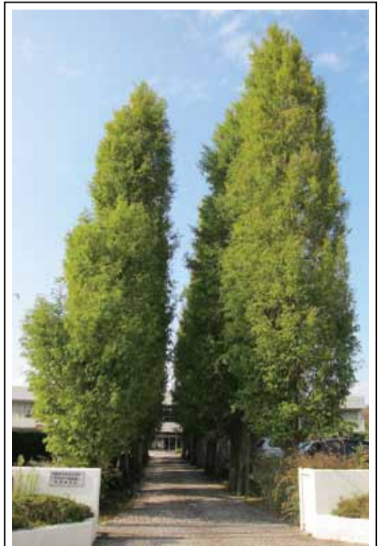
緑のプロムナード賞

徳島市では、街づくりデザイン賞を通して、市民の皆さんの街づくりに対する意識を高めていただくとともに、より一層個性と魅力ある街づくりを推進していきます。