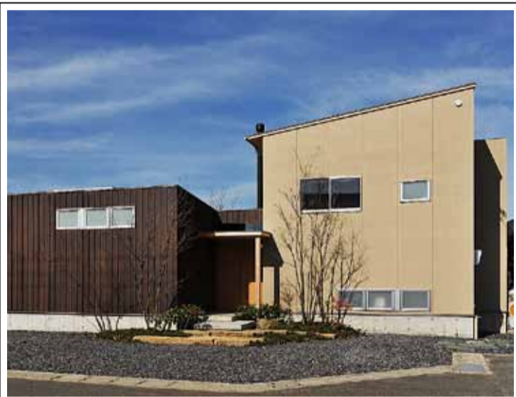
川辺のオアシス賞

～H邸～ まちなかに建つこの住宅は、現代の町屋型建築として、都市型住居の一つのモデルとなる作品となっています。2階部分に見られる木製の格子と板張りの壁は、伝統的な町屋1階部分に見られる出格子と戸袋をモチーフにしているようです。坪庭のような中庭が中央部に設けられ、植栽が住宅内部と外部に潤いをもたらせています。