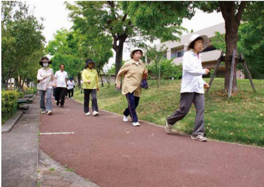
▲保健センターが実施している「からだリセット&フィットネスウオーキング」。からだを動かして健康づくりポイントを貯めましょう

【問い合わせ先】保健センター ☎(656) 0534 (FAX) (656) 0514