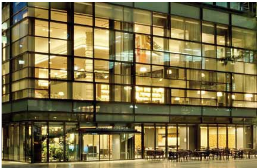
▲テスト販売場所「Rin8890」が入居する建物外観写真