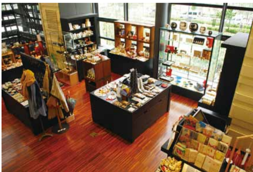
▲テスト販売場所「Rin8890」店内写真

【対象者】市内に本社がある商品の製造・加工を行う事業者 【対象商品】工芸品やインテリア雑貨、服飾、加工食品(常温管理できるもので、賞味期限が3カ月以上のもの) 【販売方法】委託販売 【出品料】無料。ただし、販売手数料(売り上げの30%)と出品に係る商品送料は参加事業者が負担 【商品選考方法】Rin8890のバイヤーが商品を選考 【結果報告】テスト販売終了後、消費者の声や売り上げに関する情報などの分析結果をRin8890の担当者から参加