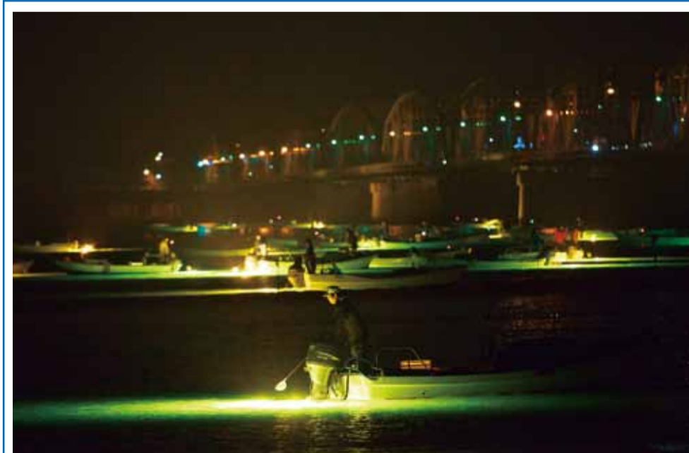
▶吉野川橋付近でのシラスウナギ漁

徳島市南部を流れる勝浦川では、アユ漁解禁の時期になると、多くの釣り人が朝早くから竿を並べて、獲物のアユを追います。夏には、家族連れで川遊びをする光景も見られます。