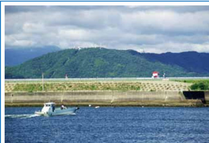
▶今切川河口を歩き来る渡船

渭東地区を南北に流れる全長2㎞程度の沖洲川。県内の高校唯一のボート部がある徳島市立高校の練習場所になっています。学校の目の前を流れており、流れも緩やかなためボート部の練習場としては最適の環境です。