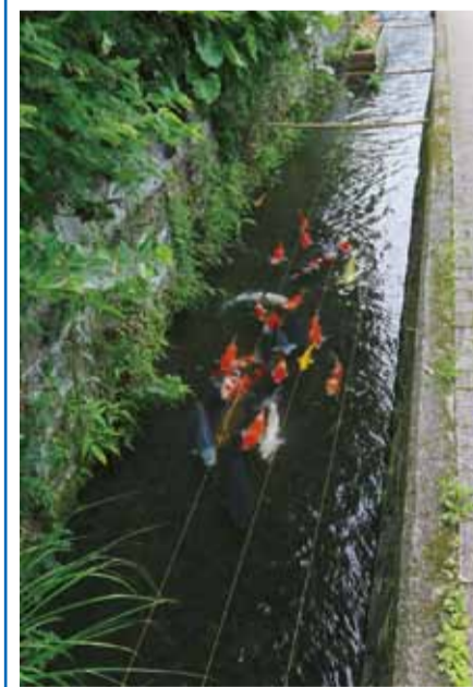
▶ニシキゴイが泳ぐ水路