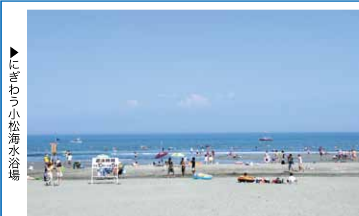
▶にぎわう小松海水浴場

川内町米津と対岸の松茂町長原を結ぶ「長原渡船」は、吉野川水系で今も残る唯一の渡しです。現在も県の委託を受けた松茂町が年中無休で運行し、中高生などが通学で利用しています。