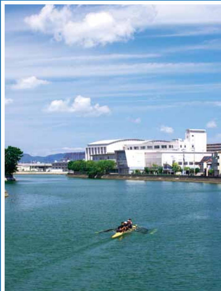
▶徳島市立高校ボート部の練習場としての沖洲川

ライトで水面を照らし、海から遡上してくるシラスウナギを見つけて網ですくいます。船が出るのは、漁に適した大潮前後の干潮から満潮にかけてで、新月の夜には多くの船をみることができま