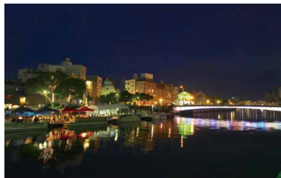
▶LEDで照らされる新町川

週末にはいろいろなイベントが開催されており、暗くなると、LEDで装飾された橋の色鮮やかな光が川面に映り、幻想的な雰囲気を表現します。