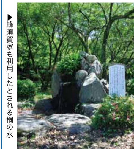
▶蜂須賀家も利用したとされる桐の水

江戸時代、徳島藩主である蜂須賀侯がお茶の湯に利用した名水が名前の由来となっています。