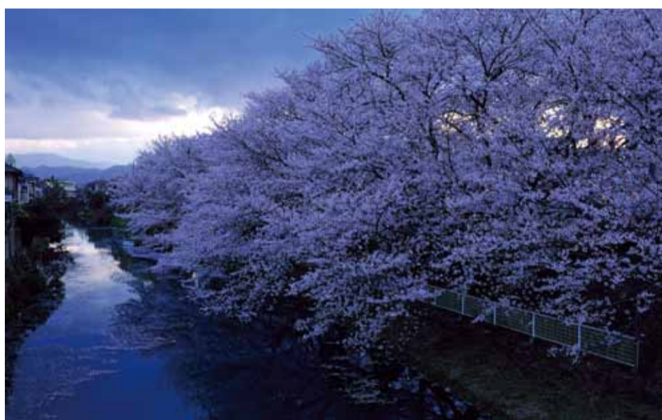
▶満開の桜と袋井用水

現在、一帯は公園となっており、毎年春になると見事な桜が咲き誇り、付近の住民の憩いの場となっています。