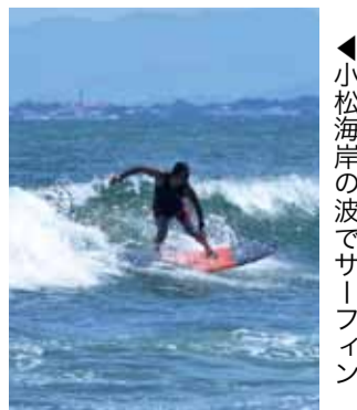
▶小松海岸の波でサーフィン

市内唯一の海水浴場として開設される小松海水浴場は、開設期間中に海の家がオープンし、ビーチイベントも開催され大勢の人でにぎわいます。サーフィンなどのマリンスポーツも盛んで、朝早くから波を楽しむ人も見られます。