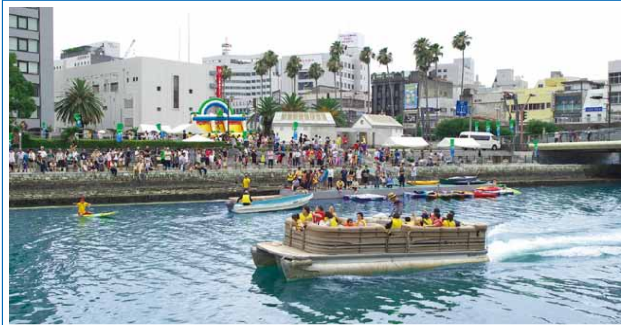
▶徳島ひょうたん島水都祭