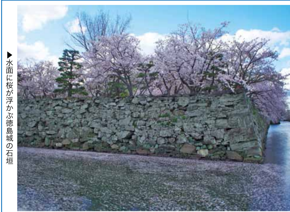
▶水面に桜が浮かぶ徳島城の石垣