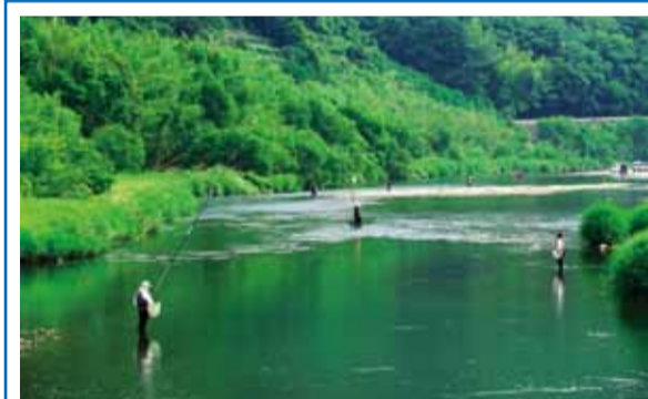
▶アユを狙い竿を振るう釣り人