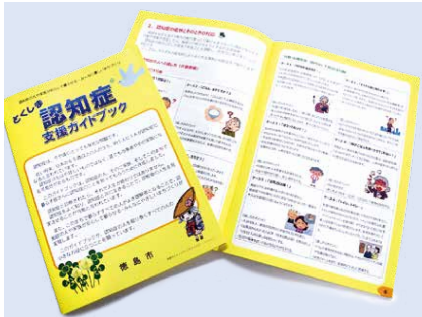
▲徳島市が作成した「とくしま認知症支援ガイドブック」

平成30年5月1日現在 (前月比) 人口/254,766人 (+183) 男/120,908人 (+92) 女/133,858人 (+91) 世帯数/119,325世帯 (+411) 面積/191.39km 2