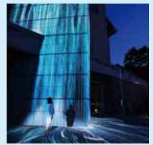
▲デジタルアート作品