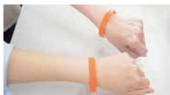
▲認知症サポーターの目印「オレンジリング」

今後も認知症高齢者の増加が見込まれる中で、認知症の人が住み慣れた地域で自分らしく、よりよく生きていくためには、社会全体で支えていくことが大切です。 その基盤として、厚生労働省と全国キャラバン・メイト連絡協議会が進めている「認知症サポーター」制度が全国で広がり、サポーターは100万人を超えました。認知症を正しく理解し、本人や家族を見守り、できる範囲で手助けを行うのが認知症サポーターです。90