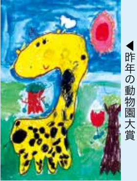
◀ 昨年の動物園大賞