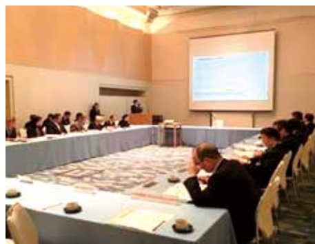
▲ネットワーク設立会の様子