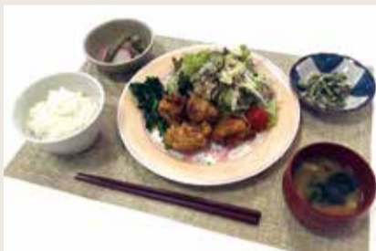
▲絆きっちゃん提供のヘルシーメニュー

【問い合わせ先】 保健センター (☎656-0534)、絆きっちゃんグローバル・アシスト認定栄養ケアステーション (☎611-0444)