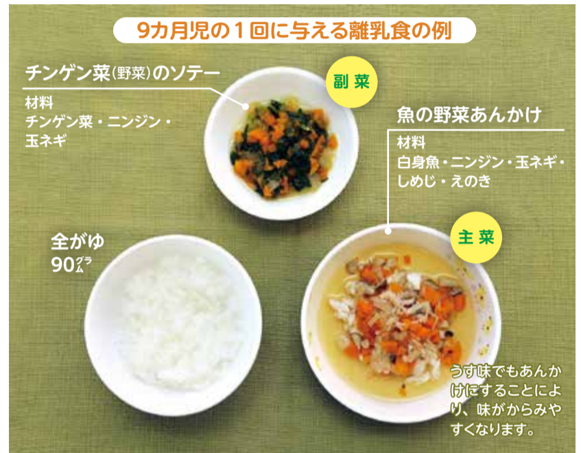
※月齢が進むにつれて、少しずつ食材の大きさを変えていきましょう。