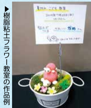
▶樹脂粘土フラワー教室の作品例