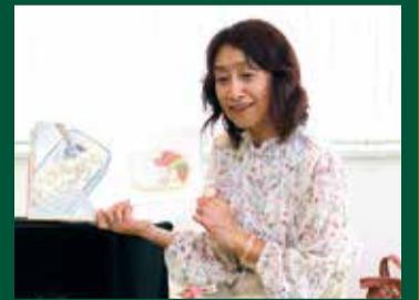
子育てイベント情報は6~7ページに掲載

絵本や昔話には生きる力がたくさん宿っています。語りを通して子どもたちの喜びや悲しみ、そしてそれぞれに違った想像力が育っていきます。子どもの中に育っていく絵本の世界を、大人も一緒になって楽しんでほしいと思います。