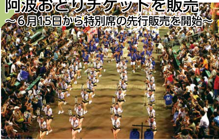
▲特別席からの風景

ことしも、阿波おどりのぞめきが聞こえてくる時季になりました。6月15日(土)10:00から、南内町演舞場特別席のチケット販売を開始します。