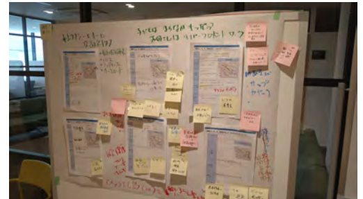
アイデアシートを使った意見交換の様子