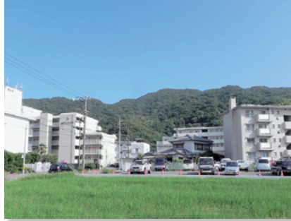
眉山北側山麓のまち並み