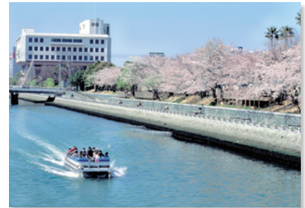
ひょうたん島クルーズ