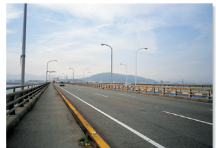
吉野川大橋橋上からの眉山は徳島の人々の心象風景になっている。

市民にとって、吉野川大橋や大野橋などからの眉山への眺望は、ふるさとに帰ってきたと感じる景観であり、また来訪者にとっては徳島を印象づけるものです。シンボル景観である眉山への眺望景観を守り、後世に伝えます。