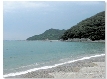
おとめ石の大神子海岸

大神子・小神子海岸は、それぞれ日峯大神子広域公園の北端、南端に位置しています。四国山地の残丘である日峯山が海に突き出し、入江となった海岸は弓状の岩礁海岸です。これらは防波堤のない海岸で、砂浜の手前には松林が広がり、後背地に山々の緑を有する自然環境豊かな海岸景観を生み出しています。