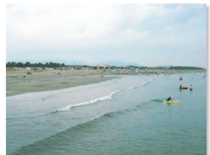
市内唯一の海水浴場の小松海岸

また、自然豊かな環境である一方、心ない人によるゴミ投棄や漂流ゴミの問題、建築行為や広告物の設置等が進むなど、周囲の環境の変化が徐々に良好な海岸景観に影響を及ぼし始めています。