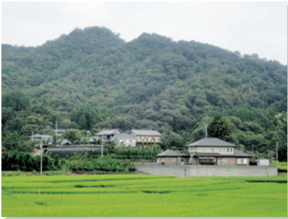
山麓に建ち並ぶ家

農山村集落ゾーンの生活景観は、山々の豊かな自然のなかの集落のほか、計画的に整備された戸建て住宅団地で形成されています。