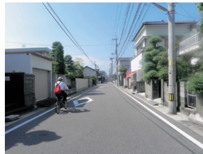
見通しの良い平坦な土地に並ぶ家