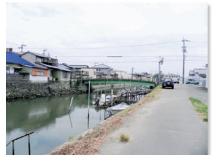
川沿いに建ち並ぶ家