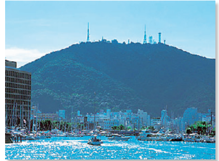
新町川からの眉山

都心ゾーンの生活景観は、商業・業務空間と居住空間が混在した賑わいのあるまち並みを構成しています。また、通りをひとつ入れば、歴史や文化と触れ合うことのできる都心のなかの落ち着いた空間が広がっています。