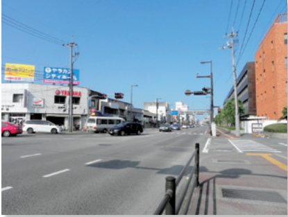
国道 192 号沿いの中低層建築物

都心ゾーンを囲むように広がる市街地であり、中低層建築物を中心とした建築物が比較的高密度に建ち並んでいます。また、徳島の景観を特徴づける眉山の眺望や水路との関わりが密接なゾーンでもあります。