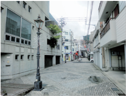
商業・業務空間と居住空間が混在したまち並み

都心ゾーンの生活景観は、商業・業務空間と居住空間が混在した賑わいのあるまち並みを構成しています。また、通りをひとつ入れば、歴史や文化と触れ合うことのできる都心のなかの落ち着いた空間が広がっています。