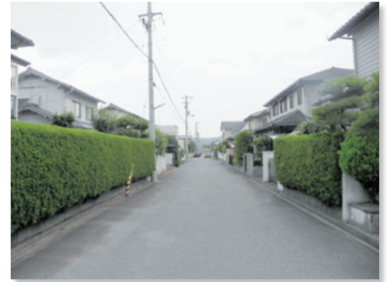
生垣が連なる戸建て住宅団地