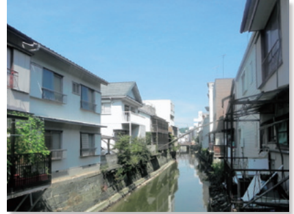
佐古川沿いの景観

周辺市街地ゾーンの生活景観は、住宅地を中心としたまち並みが広がっています。前庭のある家が建ち並び、生垣により緑化されたまち並みが見られます。