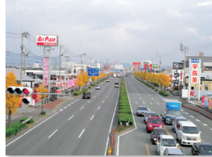
国道 11 号沿いのロードサイドショップ

田園集落ゾーンの生活景観は、田園や川に代表される自然と調和した景観が広がっています。広大な田園風景に囲まれた集落や川沿いに家が建ち並ぶまち並みが見られます。