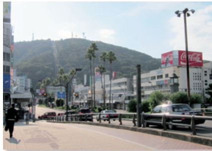
新町橋から眉山を望む