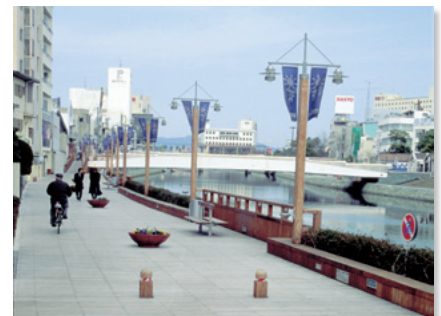
しんまちボードウォーク

新町川の富田橋から仁心橋の間の左岸には、河川に沿って带状に公園が整備され、水辺と一体となったオープンスペースが開放感を与え、本市の中心部に広がる環濠河川のなかでも最も特徴的な地域となっています。また、都市環境にあって、自然や緑に接する機会を有する数少ない貴重な空間でもあります。