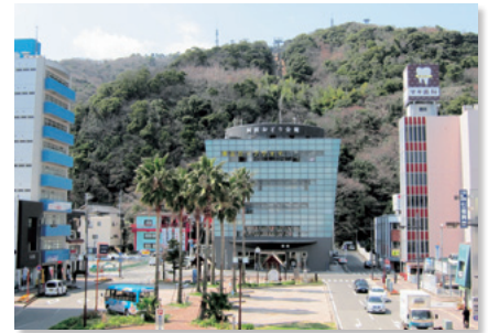
阿波おどり会館周辺