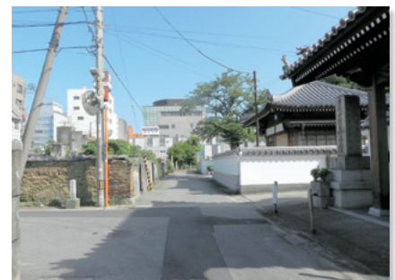
しっくいの塀が並ぶ通り

また、眉山山麓に連なる周辺地域の景観形成の気運の高まりをみて、歴史・文化景観として拡充を目指します。