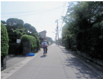
緑あふれる住宅地

周辺市街地ゾーンの生活景観は、住宅地を中心としたまち並みが広がっています。前庭のある家が建ち並び、生垣により緑化されたまち並みが見られます。