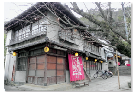
和田の屋本館下棟（登録有形文化財）