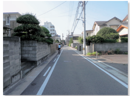
眉山東側山麓の住宅地

近年では、建物解体に伴う空地や駐車場への転用などの暫定的な土地利用によるまちなかの空洞化が見られます。都心の目指すべき景観が損なわれる要因ともなっていることから、緑化や修景等によるまち並みの連続性に配慮した景観の保全が必要です。