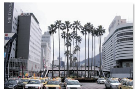
徳島駅前広場のワシントン椰子