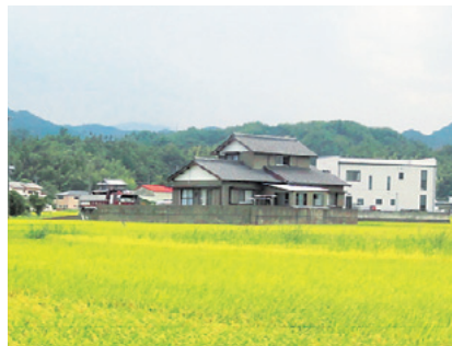
田園風景に囲まれた家