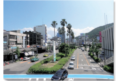
駅前広場から眉山へ続く新町橋通り

眉山や新町川などの自然環境に囲まれたうるおいのある空間を兼ね備えた商業地域として、賑わいや楽しさを創出できる魅力ある都市空間です。