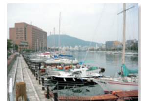
福島新橋～かちどき橋