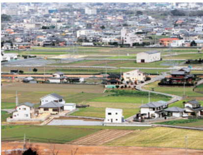
広がる田園風景のなかの家

田園集落ゾーンの生活景観は、田園や川に代表される自然と調和した景観が広がっています。広大な田園風景に囲まれた集落や川沿いに家が建ち並ぶまち並みが見られます。