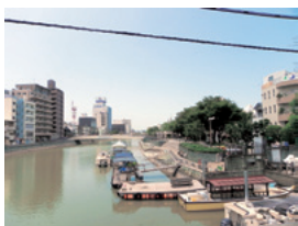
かちどき橋～新町橋