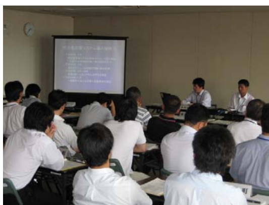
△活用事例の紹介の様子

○情報システム共同研究事業の一環として、被災者支援システムの活用事例を、徳島県主催の「平成25年度第1回公共サービス共同・連携部会（6月28日 徳島県庁）にて紹介を行い、全国の市町村でも導入が進んでいる被災者支援システムの活用事例を共有した。