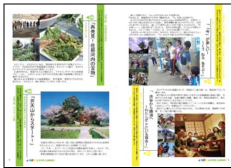
＜市民活力開発センター広報誌

センター広報紙及び利用パンフレットを圏域市町村に送付し、カウンターへの設置を依頼