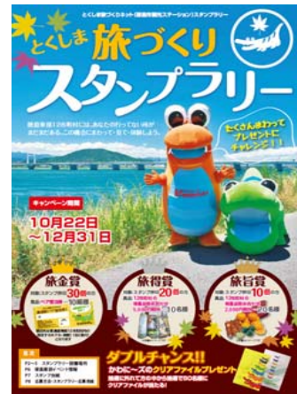
△スタンプラリーちらし