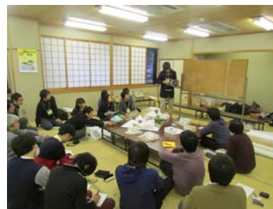
△佐那河内村での活動の様子