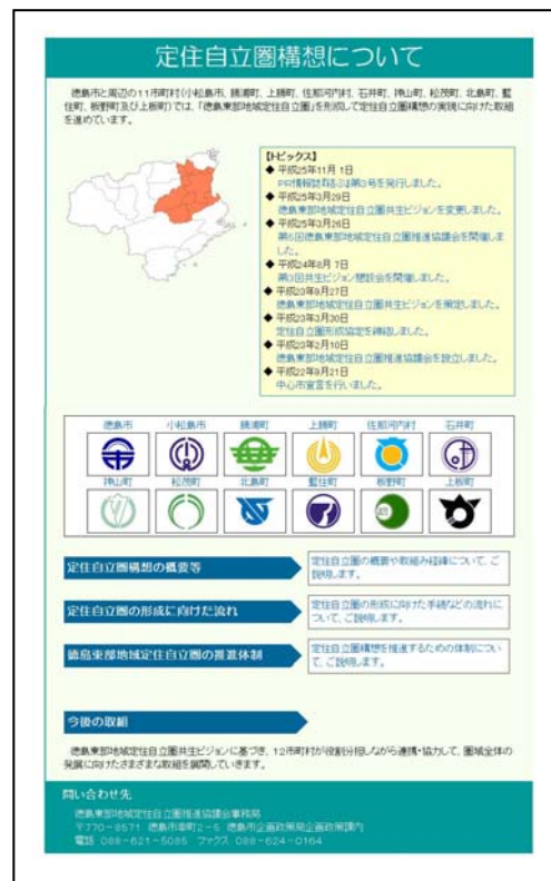
△徳島東部地域定住自立圏ホームページ (徳島市ホームページ内)