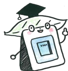
電子図書館キャラクター プレスちゃん